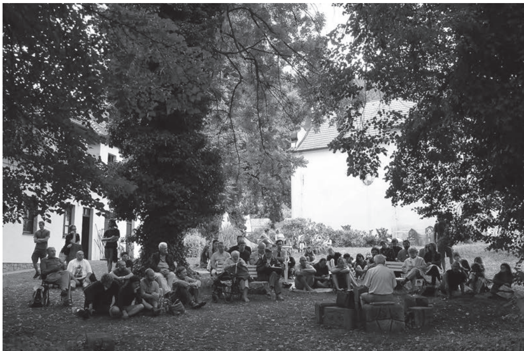
Rozmlouvající účastníci Letní filosofické školy, obklopeni zelení.

novat práci takříkajíc „podle svých schopností a podle svých potřeb“. Vystřídal postupně několik profesí, živil se mj. jako knihovník v zemědělském výzkumu, překladatel a informatik. Jeho minulost i aktuální aktivity ho několikrát vystavily novým represím. Byl sledován, roku 1961 opět zatčen, ale brzy propuštěn. Následně si na něm Státní bezpečnost vynucovala spolupráci, k níž se ovšem nikdy nezavázal.